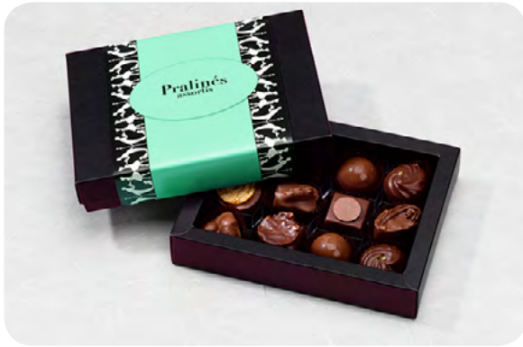
12er-“BlackBox“, Pralinés oder Truffles, CHF 16.80