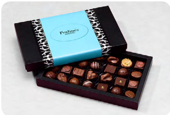
28er-“BlackBox“, Pralinés oder Truffles, CHF 38.50

Die Preise verstehen sich exkl. 2.5% MwSt. und exkl. Versandkosten.