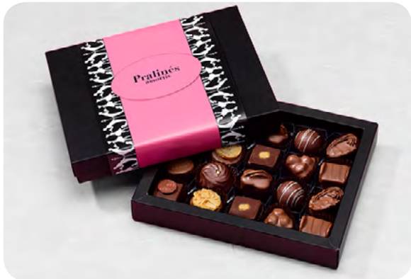
20er-“BlackBox“, Pralinés oder Truffles, CHF 28.50