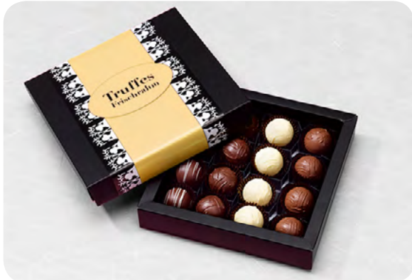
16er-“BlackBox“, Pralinés oder Truffles, CHF 23.50